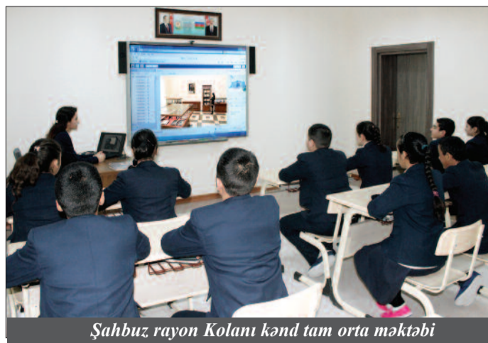
Şahbuz rayon Kolanı kənd tam orta məktəbi

1990-cı il 20 yanvar, 1992-ci il 26 fevral faciələri ilə bağlı imzaladığı sərəncamların surətləri yer alıb.