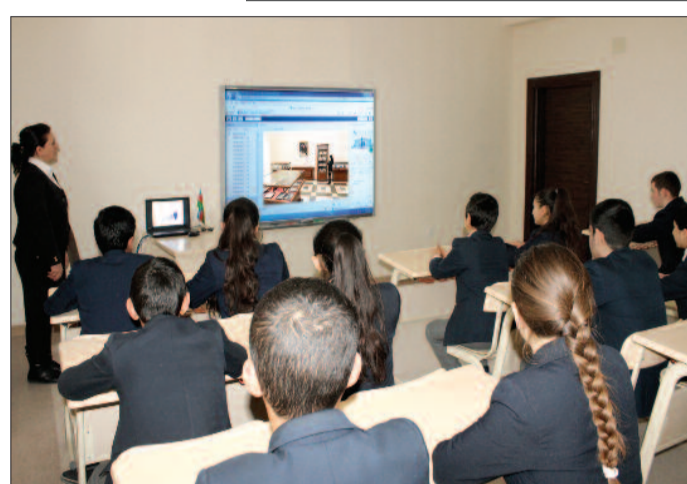
Ordubad rayon Aşağı Əylis kənd tam orta məktəbi