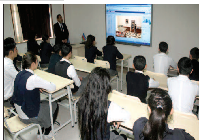
Sədərək kənd 2 nömrəli tam orta məktəb

əks etdirən sənədləri, ordenləri, fotoşəkilləri və şəxsi əşyaları var.